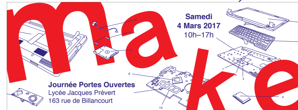
Bannière facebook 828 x 315 px